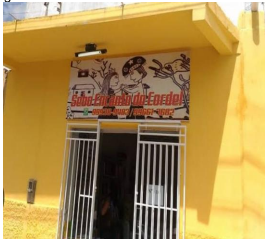
Figura 2 – Fachada do Sebo Encanto do Cordel